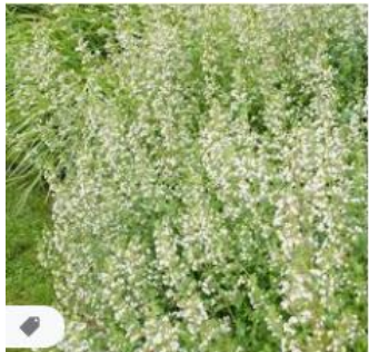
Calaminthe nepeta subsp. nep... appeltern.nl · Uitverkocht