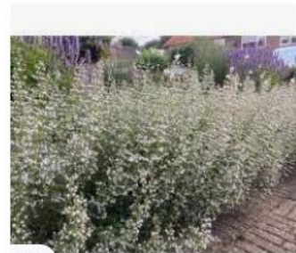
Calaminthe nepeta nepeta, ber... kwekerijvlastuin.nl · Op voorraad