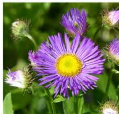
Paars met een geel hart