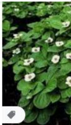
Cornus canader... plantengrow.nl ·