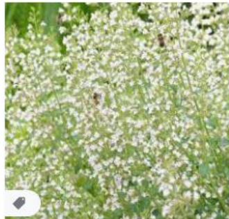
Calaminthe nepeta nepeta (Be... appeltern.nl · Op voorraad