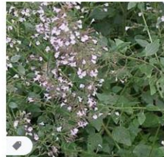
6 x Calaminthe Nepeta Nepeta... bol.com · Op voorraad