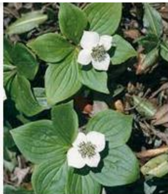
Cornus canadensis|dw... rhs.org.uk