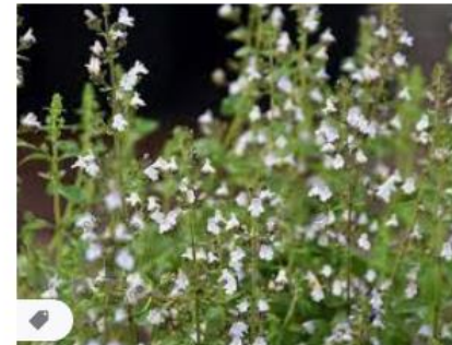
Calaminthe nepeta ssp. nepeta | Bergst... tuinplantenwinkel.nl · Op voorraad