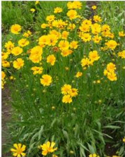
Coreopsis lanceolata heeft grondstandige bladeren