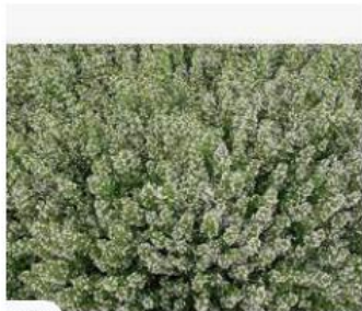
Calaminthe nepeta nepeta, ber... kwekerijvlastuin.nl · Op voorraad