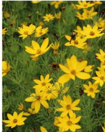
Coreopsis verticillata heeft fijne, naaldvormige bladeren